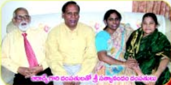
ఆచార్య గారి దంపతులతో శ్రీ సత్యానందం దంపతులు