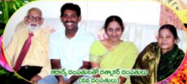
ఆచార్య దంపతులతో రత్నాశర్ దంపతులు (దేవ దంపతులు)