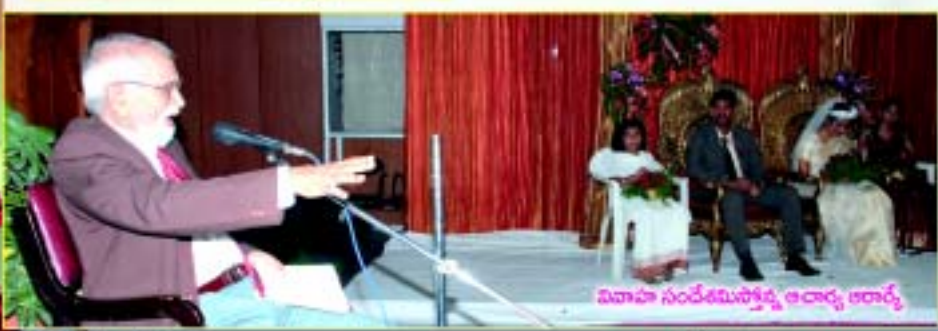
మహిళా సందేశమిస్తూన్న ఆచార్య ఆచార్య