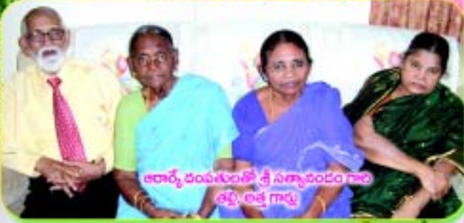
ఆచార్య దంపతులతో శ్రీ సత్యానందం గారి ఆర్టి లాక్ర గార్లు