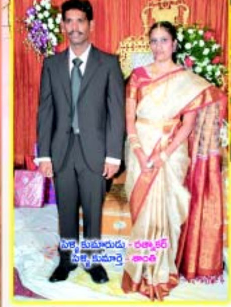
పల్లె కుమారుడు - రత్నాశర్ పల్లె కుమార్తె - శాంత