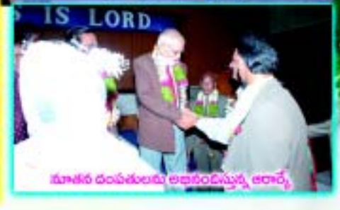
మాతన దంపతులను అభినందిస్తున్న ఆచార్య