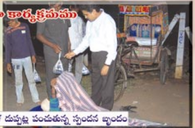
ప్రార్థనతో ప్రారంభించి క్రిస్మస్ రాత్రివేళ దుప్పట్ల పంచుతున్న స్వందన బృందం

గమనించి పిలిస్తే అందులోనించి ఓ యువకుడు బయటకు వచ్చాడు. కొంత ఆశ్చర్యం, బాధ కలిగాయి. వేది, వేది బోజనం ప్యాకెట్లు తీసుకుని ఆత్రంగా తినేవారిని చూస్తే ఎంత ఆకలితో ఉన్నారో అర్థమవుతుంది.