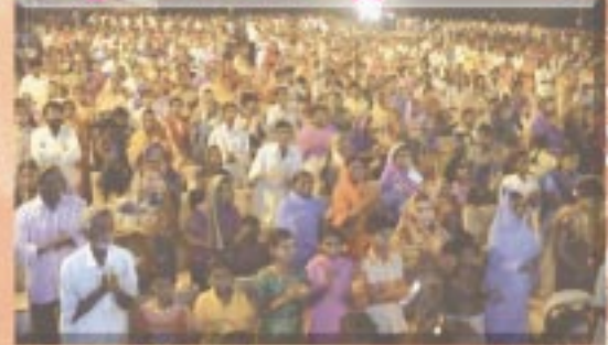
విశాఖ జిల్లా అనకాపల్లి మహాసభలు