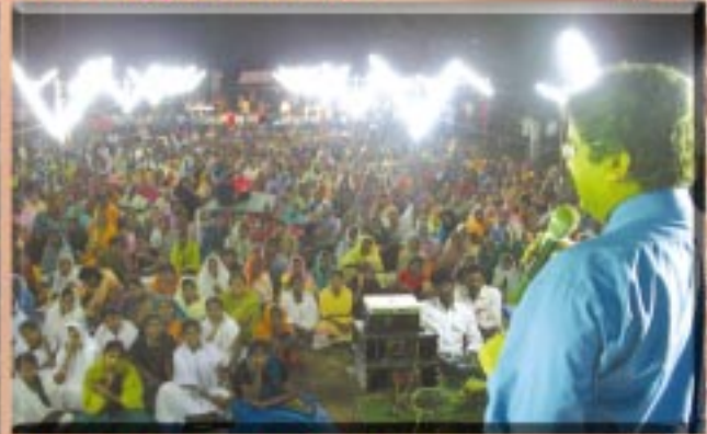
ప|| గో|| జిల్లా, శ్రీనివాసపురం మహాసభలు