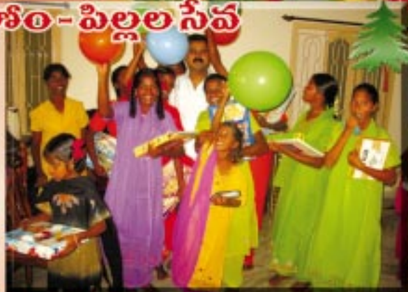
ఆచార్య ఆరార్యే, డా॥ దేవ గార్లతో హోం పిల్లలు