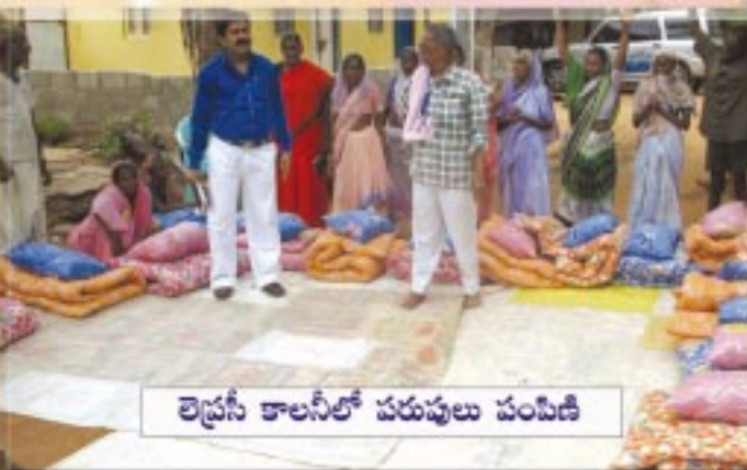
లెప్రసీ కాలనీలో పరుపులు పంపిణీ

చాలా సార్లు వీరిని వ్యక్తిగతంగా చూస్తేతప్ప వారి బాధ, వేదన మనకు అర్థం కాదు. అకలి కడుపుతో, చలికి కాళ్లు కడుపులోనికి ముడుచుకుని పడుకుని ఉంటారు కొందరు. మరి కొందరు ప్లాస్టిక్ సంచులకు, సిమెంట్ సంచులను దుప్పటిలాగా కుట్టుకుని పడుకుని ఉంటారు. రోడ్డు మీద వివిధ రకాల బ్యానర్లు కడుతారు కదా! వాటిని కప్పుకుని పడుకుని వుంటారు కొందరు. ఓ సారి ఈ ప్లాస్టిక్ బ్యానర్లు కప్పుకుని, అవి మళ్లా పోతాయనుకున్నాడో, లేదా ఎవరన్నా తీసుకెడతారనుకున్నాడో గాని తాడుతో దానిని తనకు కట్టుకుని పడుకుని ఉన్న కుర్రాణ్ణి చూశాము. అదేదో కట్టిపడేసిన పెద్ద మూటలా కనిపించింది. మన బృందంలోని సోదరులు అది