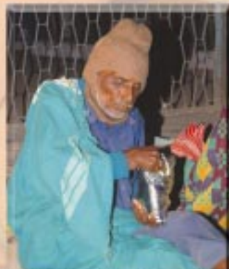
బోజనం ప్యాకెట్లు, దుప్పట్లు పంచే కార్యక్రమం