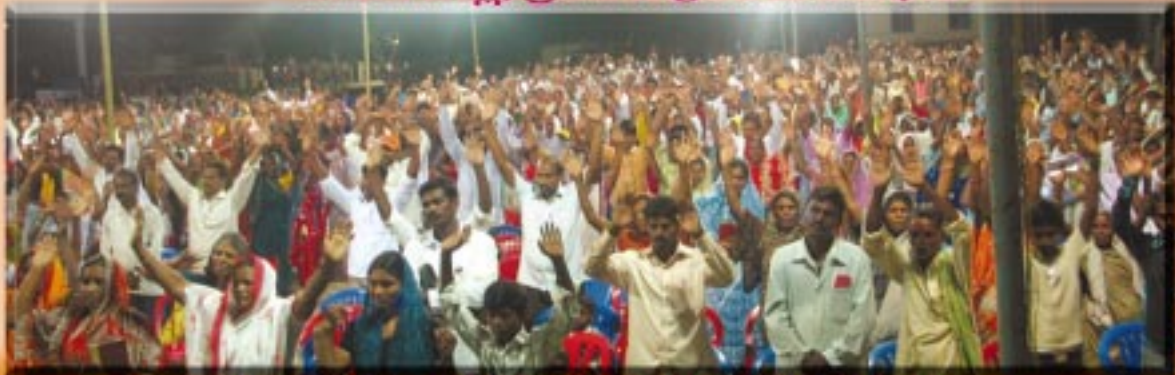
ప్రకాశం జిల్లా సంతనూతలపాడు మహాసభలు