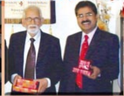
గల్ఫ్ దేశాల్లో ఆచార్య ఆరార్యే, డా|| దేవ గార్లు