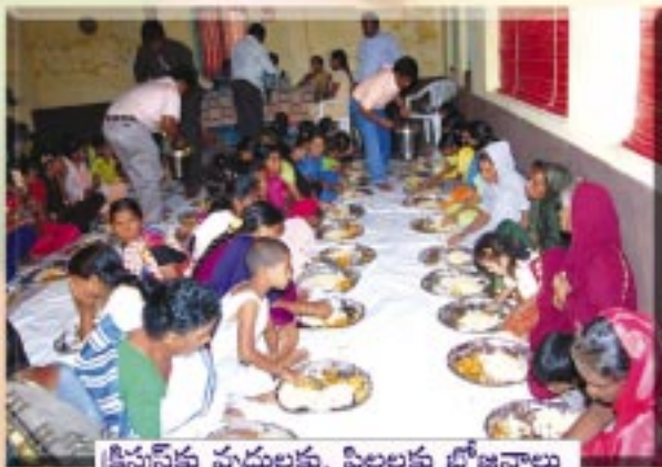
క్రిస్ట్యన్లకు వృద్ధులకు, పిల్లలకు భోజనాలు