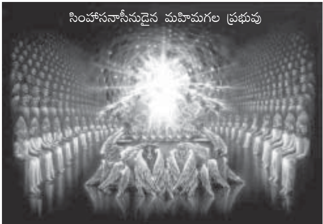
సింహాసనాసీనుడైన మహిమగల ప్రభువు

నిత్యుడు, ఆయన ఉనికి నిత్యమైనది. దానియేలు గ్రంథం 7:9 ఆయన సింహాసనాసీనుడు, మహావృద్ధుడు. ఆయన వస్త్రములు హిమమువలె దవళముగాను ఆయన వెంట్రుకలు శుద్ధమైన గొర్రె ఉన్నివలె తెల్లగా ఉన్నాయి. ఆయన కన్నులు అగ్నిజ్వాలలు. యేసు నీ హృదయములోకి, అంతరిందియములలోకి సూటిగా చూడగలడు. నీ అంతర్యమును ఆయన బాగా ఎరుగును. ఆయన పాదములు అపరంజితో సమానం. కొలిమిలో పుటము పెట్టబడిన అపరంజి. అది తీర్చును సూచిస్తుంది. యేసు మరణానికి అది సంకేతం. ఇత్తటి బలిపీఠం. మనకు రావలసిన తీర్పునకు ఆయన గురి అయ్యాడు. సంఘం మారుమనస్సు పొందాలి. ఆయన స్వరం విస్తారమైన జలప్రవాహముల ధ్వని. అధికారపూర్వకమైన మహాధ్వని. ఈయనే ప్రభువైన యేసుక్రీస్తు. ప్రకటన 1:16-20 ఆయన తన కుడిచేత ఏడు నక్షత్రములు పట్టుకొని ఉన్నాడు. ఆయన నోటినుండి రెండంచుల గల వాడియైన ఖడ్గమొకటి బయలువెడలుతున్నది. ఆయన ముఖము మహాతేజస్సుతో ప్రకాశిస్తున్న సూర్యునివలె ఉన్నది. నేను ఆయనను చూడగానే చచ్చినవాని వలె ఆయన పాదముల యెద్ద పడ్డాను. ఆయన తన కుడిచేతిని నామీద ఉంచి నాతో అన్నాడు “భయపడకు నేను మొదటివాడను కడపటివాడను జీవించేవాడను, మృతుడనయ్యాను గాని ఇదిగో యుగయుగములు సజీవుడనై ఉన్నాను. మరియు మరణము యొక్క పాతాళలోకము యొక్క తాళపు చెవులు నా స్వాధీనములో ఉన్నాయి. కాగా నీవు చూచిన వాటిని విన్నవాటిని వీటి వెంట కలుగబోయే వాటిని అనగా నా కుడిచేతిలో నీవు చూచిన యేడు నక్షత్రములను గూర్చిన మర్మమును, ఆ యేడు సువర్ణ దీప స్తంభముల సంగతిని వ్రాయి.