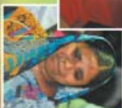
ప్రభును గర్జితలో పశ్చాత్తాప ప్రార్థనలు