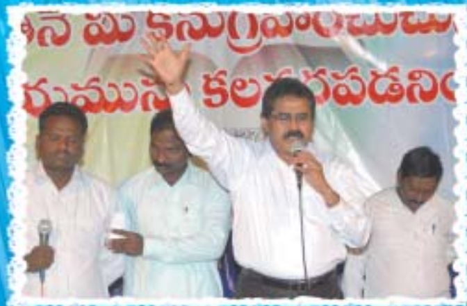
డా॥ దేవ గారి ప్రార్థన