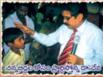
ఎన్నడూడల కోసం ప్రార్థన చేస్తున్న దా.దేవ