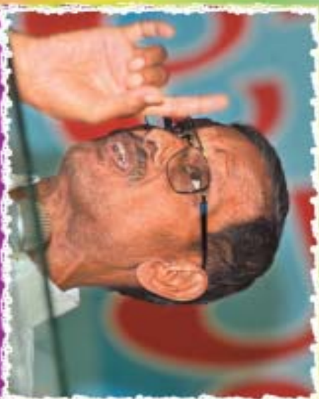
సందేశమిస్తానన్న బుద్ధర్ పసన్న గారు