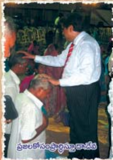
ప్రజలకోసం ప్రార్థన చేస్తున్న దా.దేవ