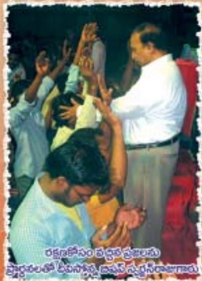
రక్షణ కోసం వచ్చిన ప్రజలను ప్రార్థనలతో బీటనిస్తూ దా.దేవ స్పృహను తెలుపుతూ