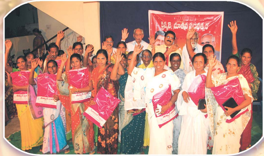
క్రిస్టసు, నూతన సం॥ సందర్భముగా దైవసేవకురాండ్లు కొందరికి నూతన వస్త్రాలు బహుకరణ