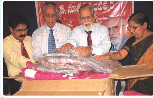
పంపిణీ చేయబోయే వస్త్రాలు కోసం ప్రార్థన