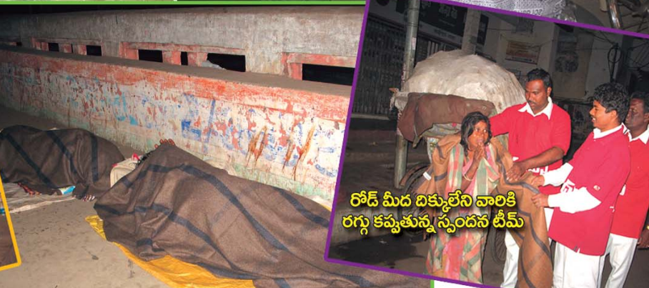
రోడ్ మీద దిక్కులేని వారికి రగ్గు కప్పతున్న స్పందన టీమ్