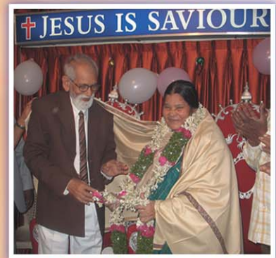
ఆరార్కే గారి 82వ బర్త్ డే సందర్భముగా దండలు మార్చుకుంటూ..