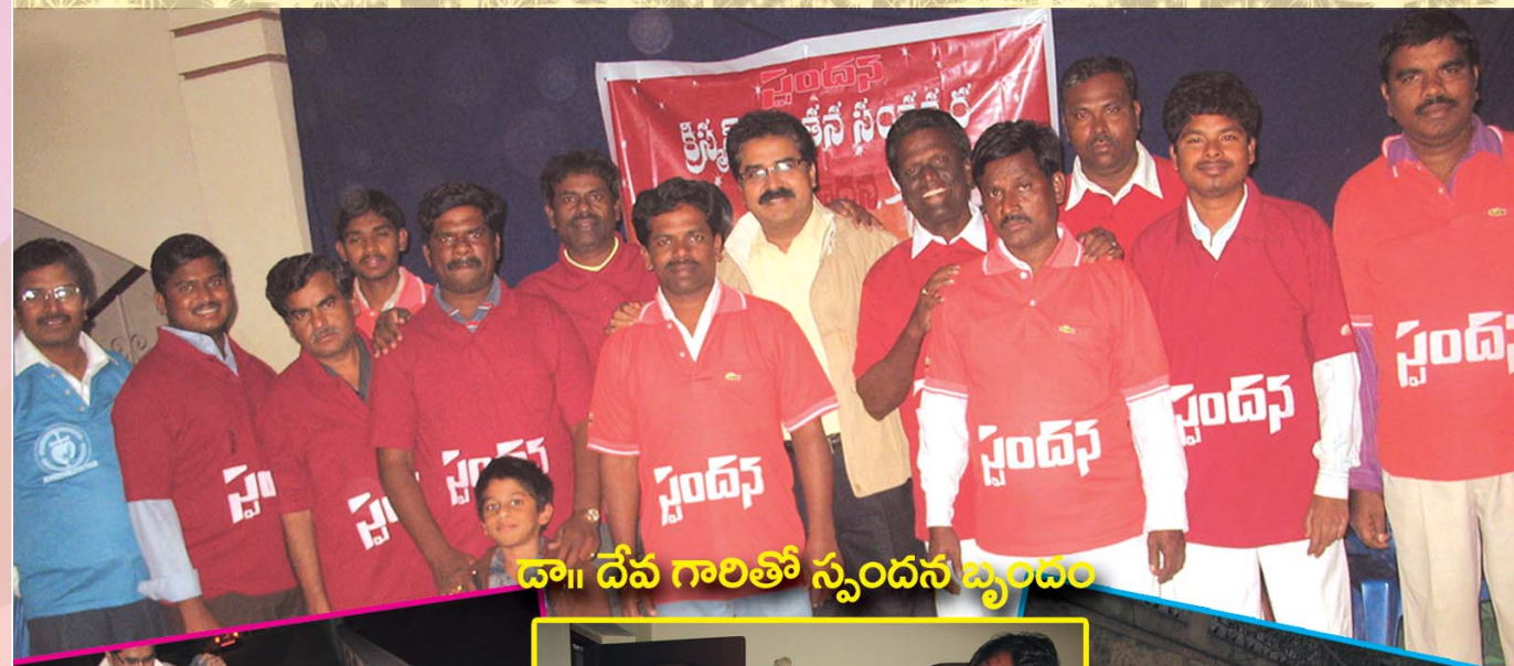
డా॥ దేవ గారితో స్పందన బృందం