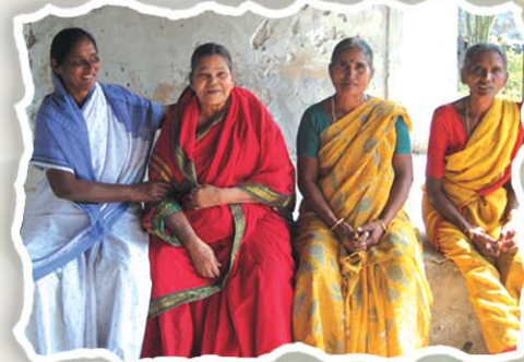
గోవిందపురంలోని ఆరార్కే గారి స్వగృహములో