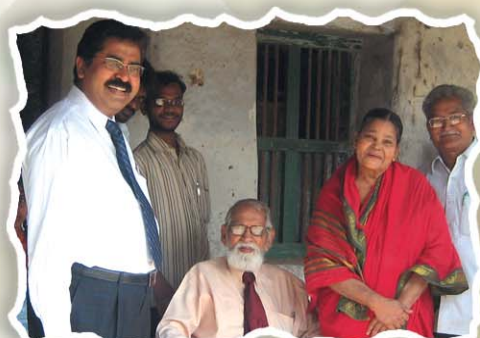
గోవిందపురంలోని ఆరార్కే గారి స్వగృహములో