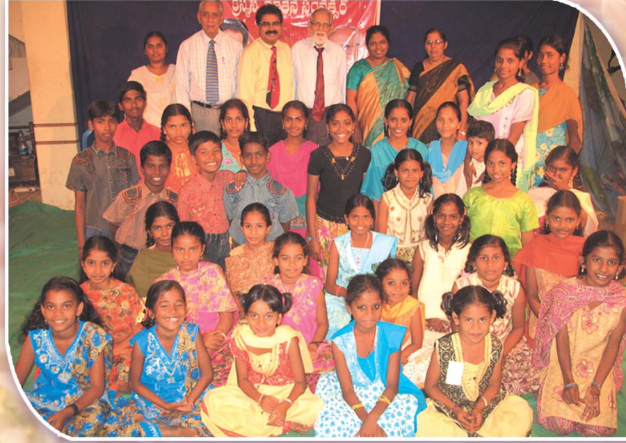
క్రిస్టసు, నూతన సం॥ సందర్భముగా నూతన వస్త్రాలతో లిటిల్ ఏంజిల్ హోమ్లోని బాలలు

Licensed to post without pre-payment Regd No. VJ/057/2009-11 RNI No: 32106/76