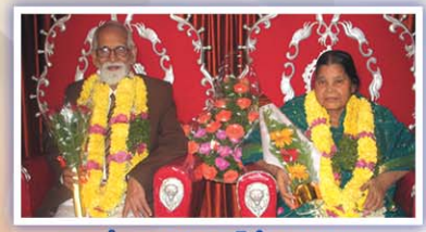
ఆరార్కే గారి 82వ బర్త్ డే సందర్భముగా