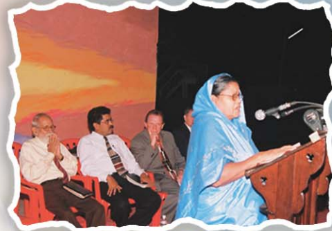
సత్తెనపల్లి మహాసభలో సాక్షుమిస్తూ...

నేను నరసారావు పేటలో చదువుకునే రోజుల్లో మా సంస్కృతం మాష్టారు చాలా తరచుగా- తన నాడి పని చేస్తుందా? లేదా? అని చూసుకుంటుండేవాడు. ఆయన భయం ఏంటంటే చనిపోతానేమో! స్టూడెంట్స్ లో నేనే కొంచెం గడుసోణ్ణి, నేనన్నాను - "మాష్టారు! మాష్టారు! మీరు ప్రతి నిమిషం చచ్చిపోతానేమోనని నాడి పరీక్షించుకుంటున్నారు, కాని మీరు ప్రతి నిమిషం చచ్చిపోతున్నారండీ" అన్నాను. 'అదేంటిరా', అన్నాడు