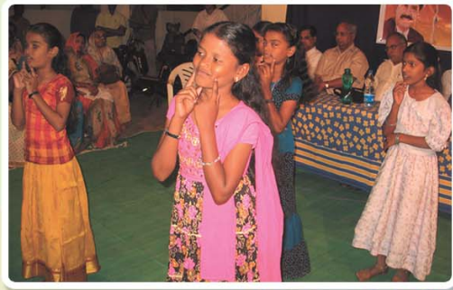
లిటిల్ ఏంజల్స్ హోమ్ బాలికల యాక్షన్ సాంగ్స్