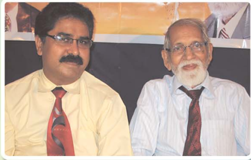
ఆచార్య ఆరార్కే, డా॥ దేవ