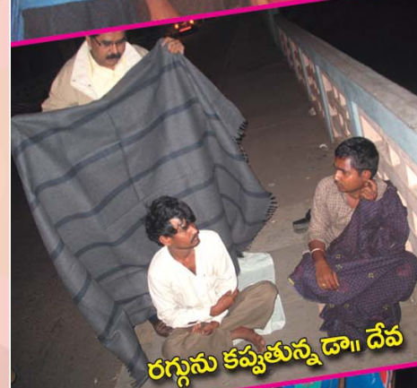
రగ్గును కప్పతున్న డా॥ దేవ