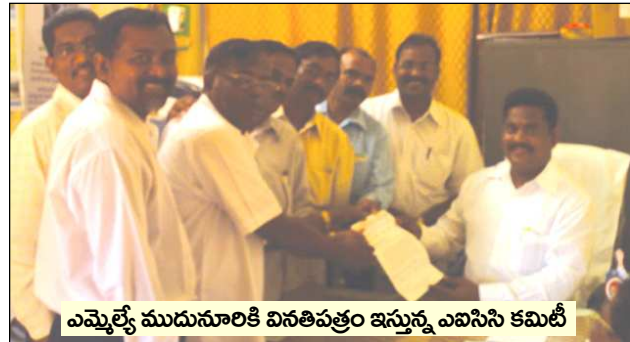
ఎమ్మెల్యే ముదునూరికి వినతిపత్రం ఇస్తున్న ఎఐసిసి కమిటీ

కలిసి ఇదే విషయమై వినతి పత్రాన్ని సమర్పించగా వారు కూడా ఈ విషయమై సానుకూలంగా స్పందించి తగు స్థలాన్ని సేకరించి ఈ సమస్యను పరిష్కరిస్తామని హామీ ఇచ్చారు.