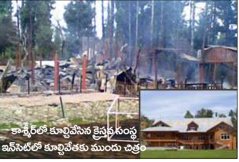
కాశ్మీర్ లో కూల్చివేసిన క్రైస్తవ సంస్థ ఇన్ సెట్ లో కూల్చివేతకు ముందు చిత్రం