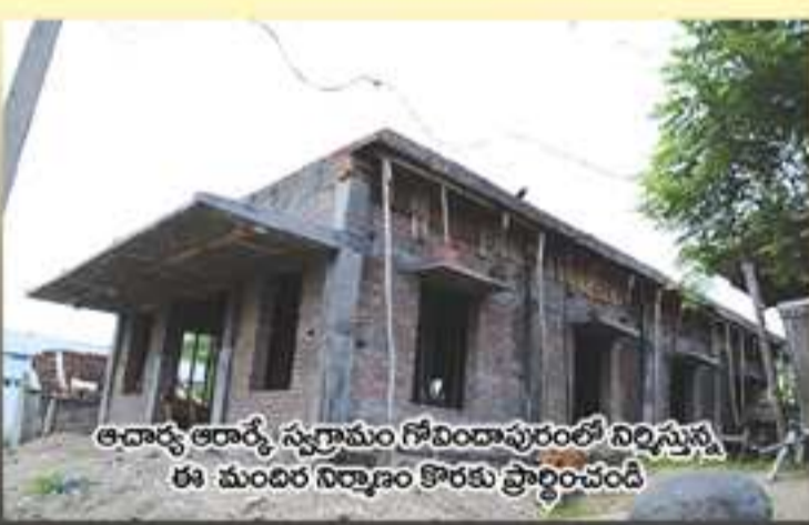
ఆచార్య ఆరాధ్య స్మారకము గోవిందాపురంలో నిర్మిస్తున్న ఈ మందిర నిర్మాణం కౌరకు ప్రార్థించండి