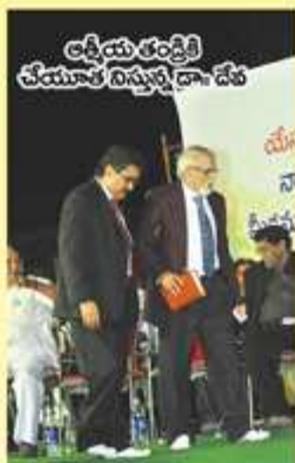
ఆక్రీయ తండ్రి చేయూత నిస్తున్న డా. దేవ