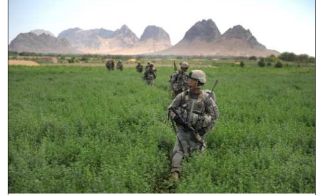
ఉత్తర ఆఫ్ఘాన్ లోని క్రైస్తవ మిషనరీలను చంపుతామని తీవ్రవాదులు హెచ్చరించడంతో ఆగస్టు 6వ తేదిన ఆఫ్ఘాన్ సైనికులతో కలసి పిల్లోలింగ్ చేస్తున్న అమెరికా సైనికులు

(మొదటి పేజీ తరువాయి) వైద్యసేవలందిస్తు బన్ను ప్రాణాలతో విడిచిపెట్టారు. మృతి చెందినవారి న్నారు. కనీసం పశ్చి తోముకునే టూత్ బ్రష్ ఎలా లో ఒకరు బ్రిటన్, ఒకరు జర్మనీ, ఇద్దరు ఆఫ్ఘన్ కు వుంటుందో కూడా తెలియని ప్రజల మధ్యకు వెళ్ళి అక్కడి పిల్లలకు, పెద్దలకు దంత వైద్య సేవ లందించి అక్కడి ప్రజలు వ్యాధుల బారిన పడకుండా వీరంతా సేవలందిస్తున్నారు. అలాగే నేత్ర వైద్యం కూడా వీరు ఉచితంగానే దశాబ్దాల తరబడి అందజేస్తున్నారు. అయినప్పటికీ తాలిబన్ తీవ్రవాదులకు ఇవేమీ అక్కర లేదు, కేవలం వీరు అక్కడి ప్రజలను క్రైస్తవ మతంలోని మార్చేస్తున్నారేమోనన్న అపోహ ఒక్కటి