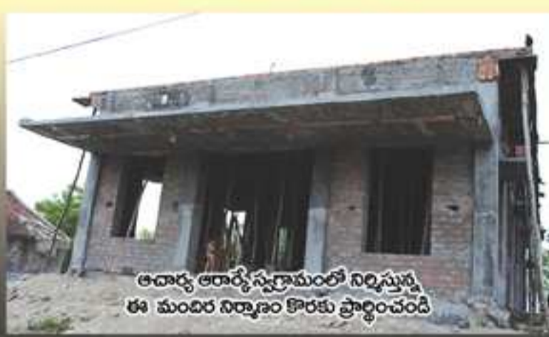
ఆచార్య ఆరాధ్య స్మారకములో నిర్మిస్తున్న ఈ మందిర నిర్మాణం కౌరకు ప్రార్థించండి