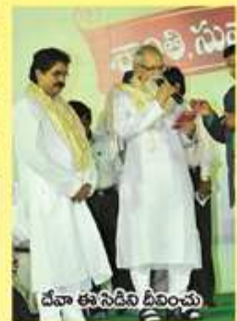
దేవా ఈ సదీవి బిరించు