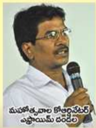
మహోత్సవాల కోఆర్డినేటర్ ఎత్తాయిమ దండేల్