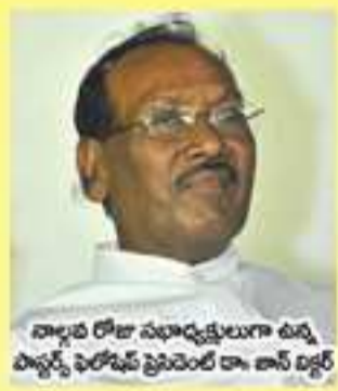
వ్యాధి రోజు సభార్యత్వముగా ఉన్న బిల్లర్స్ ఫిలోజఫీ ప్రతిపదిల్ డా. బిల్లర్