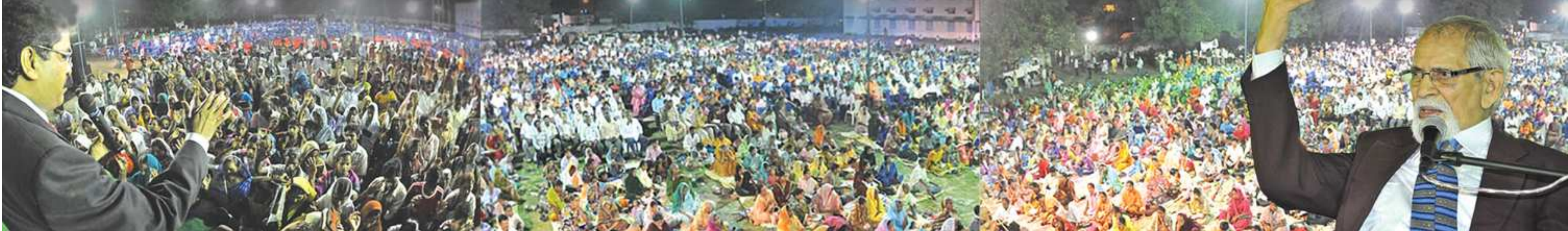
వ్యాక్య ప్రకటన అనంతరం వ్యక్తిగత నిర్ణయాలకు ప్రజలను ప్రార్థనలో నడిపిస్తున్న డా. దేవ