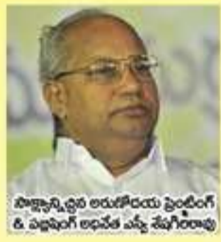
పాల్కాన్ని ధైర్య అయిపోయే ప్రతిపదిల్ కి పట్టాంగి అధికార వ్యక్తి శేషిరావు