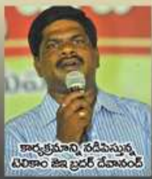
కార్యక్రమాన్ని నడిపిస్తున్న టిరికాం జిల్లా బ్రదర్ దేవారం