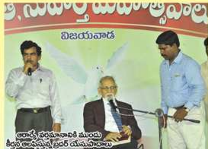
ఆరాధ్య పరమనానికి ముందు కిర్రణ అలవిస్తున్న బ్రదర్ యసుపాదాలు