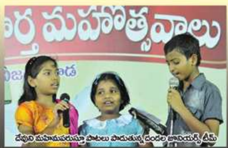
దేవుని మహిమను పాటలు పాడుతున్న దండేల్ జానియర్, డి.మ