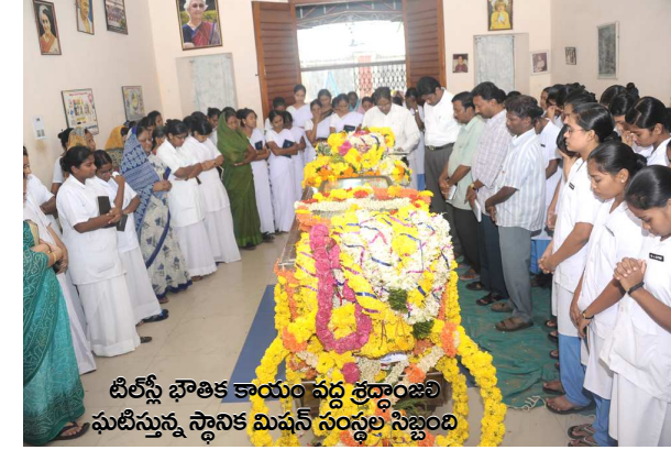
టిల్స్ భౌతిక కాయం వద్ద శ్రద్ధాంజలి ఘటించున్న స్థానిక మిషన్ సంస్థల సభ్యులు