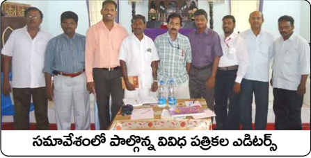
సమావేశంలో పాల్గొన్న వివిధ పత్రికల ఎడిటర్స్

రాజమండ్రి (తూ.గో.జిల్లా) : క్రైస్తవ పత్రికలు దేవుని రాజ్యం కొరకు సిద్ధపరిచే దిశగా పనిచేయాలని, సమాజంలో మార్పు తేవాలని క్రైస్తవ పత్రికల ఎడిటర్ల సమావేశం కోరింది. పత్రికల బ్యానర్ ఐటమ్స్ అందరూ కలిసి ప్రచురిస్తే పత్రికల ఐక్యత సమాజానికి తెలుస్తుందని