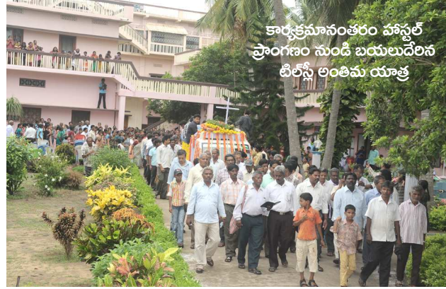
కార్యక్రమానంతరం పోస్టల్ ప్రాంగణం నుండి బయలుదేరిన టిల్స్ అంతిమ యాత్ర