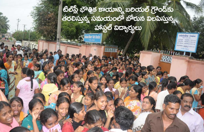
టిల్స్ భౌతిక కాయాన్ని బరియల్ గ్రౌండ్కు తరలిస్తున్న సమయంలో బోరున విలసిస్తున్న హాస్పిటల్ విద్యార్థులు