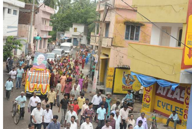
వలందరేపు-మిషన్ హైస్కూల్ ప్రధాన రహదారిలో టిల్స్ అంతిమ యాత్ర