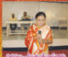
ప్రార్థన - ప్రేమలక్ష్మి దేవి