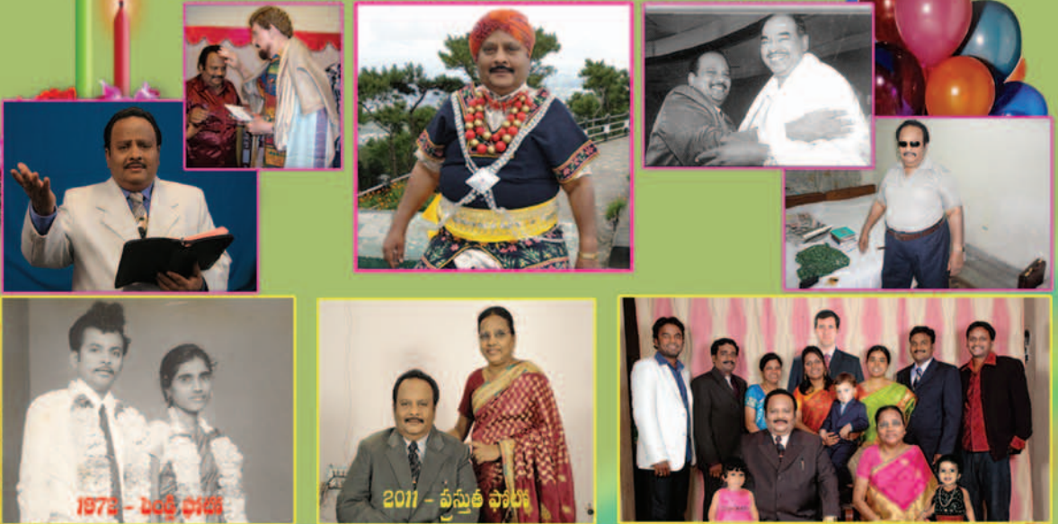
1972 - బండ్ల ధానియా

ఆరాధన - గుంటూరు, విద్యాబంధుల శ్రీ ప్రస్థానం ఎడ్యుకేషన్ రిసెర్చ్ (ఆరీయం) గ్రాంట్ మరియు సర్టిఫికేట్ బిగింపు కేంద్రం