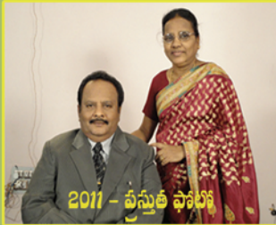
2011 - వస్తుతీ ఫోటో