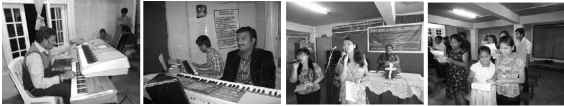
సభలకు పోజరైన ప్రజలు