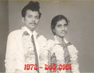
1972 - పెండ్లి ఫోటో