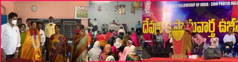
Tharupadu high school Ravi memorial church Meeting at Mylavaram