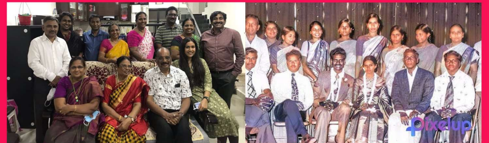
relatives group photo