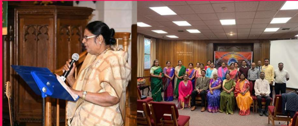
UECF silver jubilee greetings Penuel prayer members