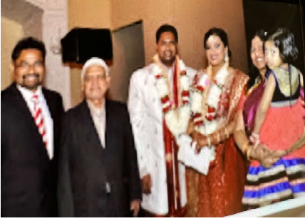
యు.ఇ.సి.యఫ్ ప్రెసిడెంట్ స్నేహితుల వివాహంలో ఫోటో